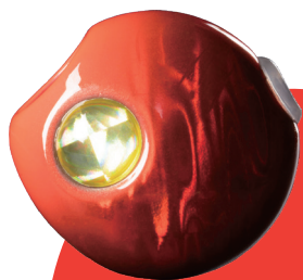
2step TG Type2